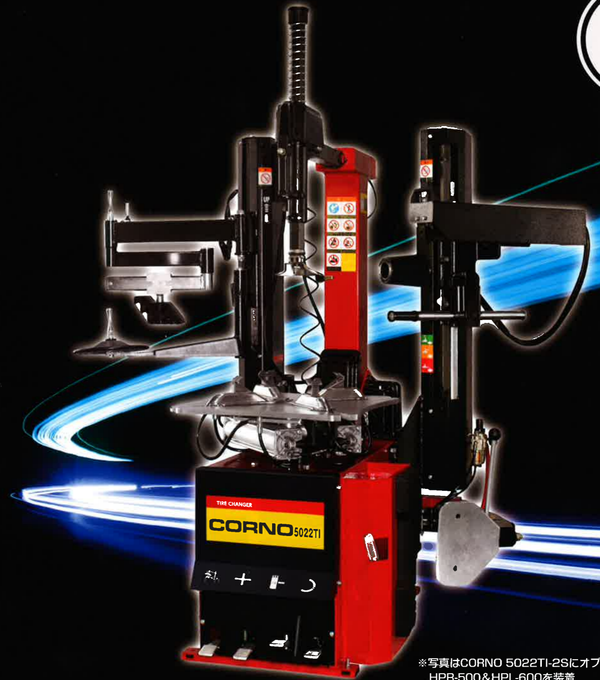
※写真はCORNO 5022TI-2SにオプションのHPR-500&HPL-600を装着

⚠ 安全に関するご注意 ご使用の前に「取扱説明書」をよくお読みの上、正しくご使用下さい。